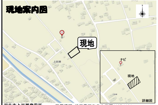
羽生市上岩瀬発電所 設置場所: 埼玉県羽生市上岩瀬1127,1191 (ナビ: 埼玉県羽生市上岩瀬1131)